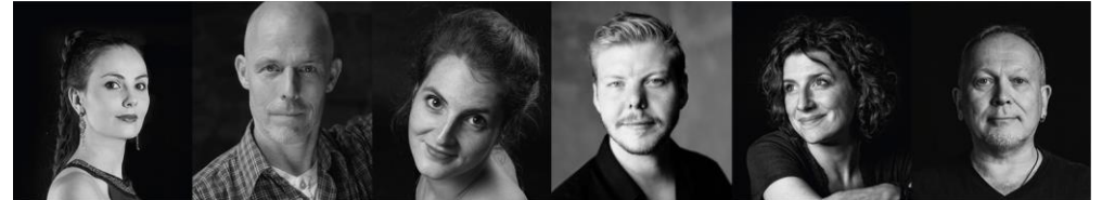
Carmen Don José Micaëla Escamillo Mercédès Dancaïro

Carmen, eine Zigeunerin Don José, ein Sergeant Micaëla, ein Mädchen Escamillo, ein Torero Mercédès, eine weitere Zigeunerin Dancaïro, ein Schmuggler